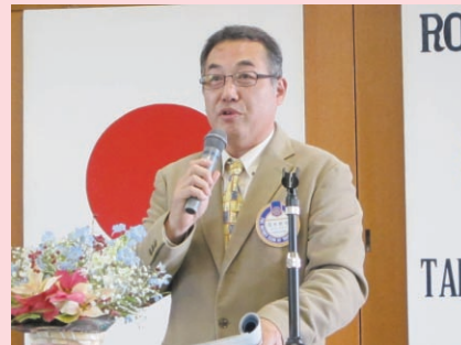
岡本クラブ会報委員長