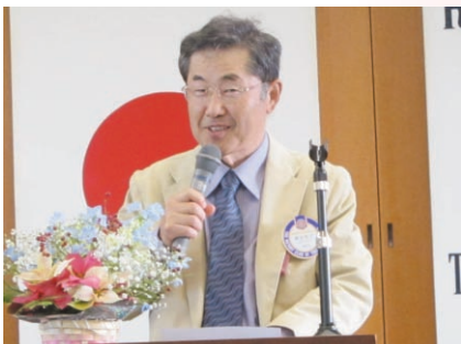
菱田ロータリー情報委員長