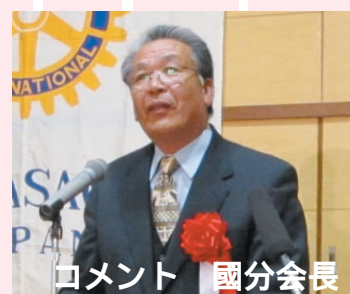
コメント 國分会長