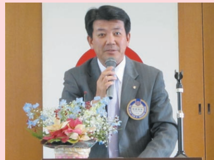
都倉雑誌・広報委員長