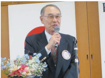
京谷プログラム委員長