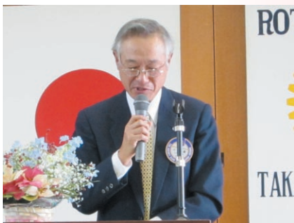
内海クラブ奉仕委員長