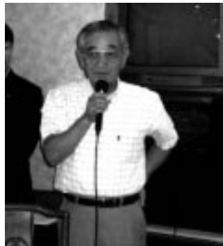
高砂青松ロータリークラブ 会長挨拶