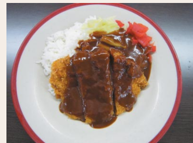
昼食メニュー かつめし