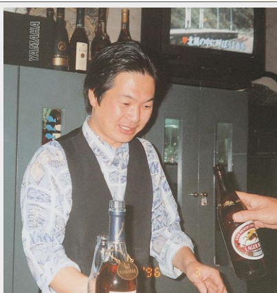
スナックを経営していた時の写真