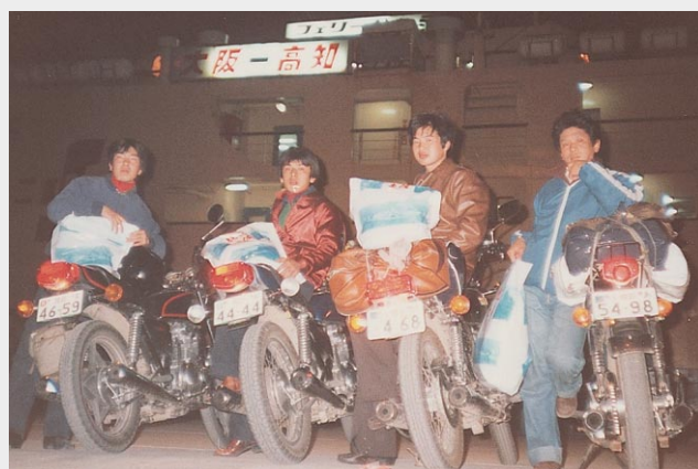
高校時代にバイクで四国へツーリングした時の写真