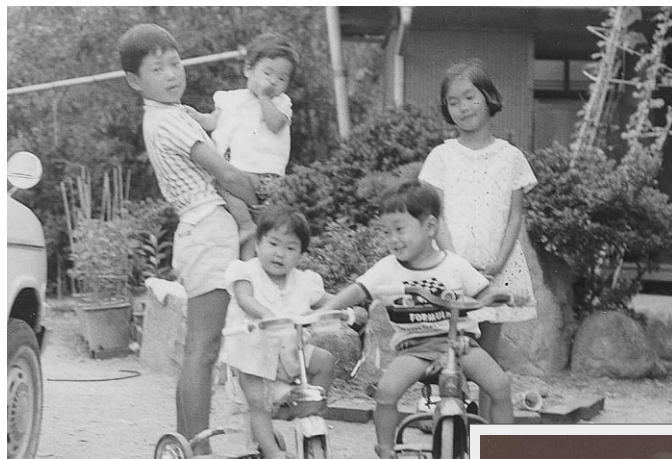
5人兄弟の長男です。(左端)