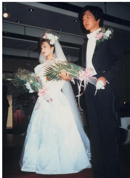
鹿島殿のモデルになった写真