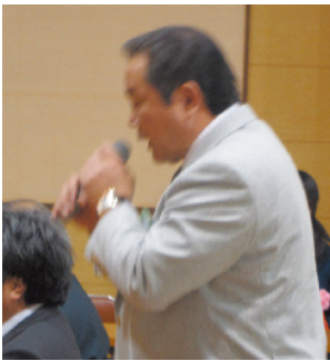
コメント 高砂 R.C 井本 会員