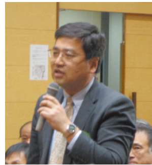
コメント 高砂 R.C 狩野 会員