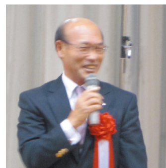
滝川第二高校校長