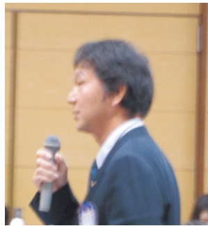
コメント 高砂青松 R.C 松下 会員