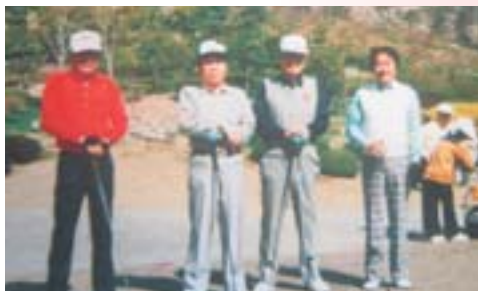
JC時代に参加した 5クラブゴルフコンペ (右端が私でその隣が 京谷会員です)