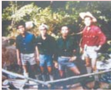
友人と行った上高地 中心の2人は踏切事故で20代で 故人となってしまいました。