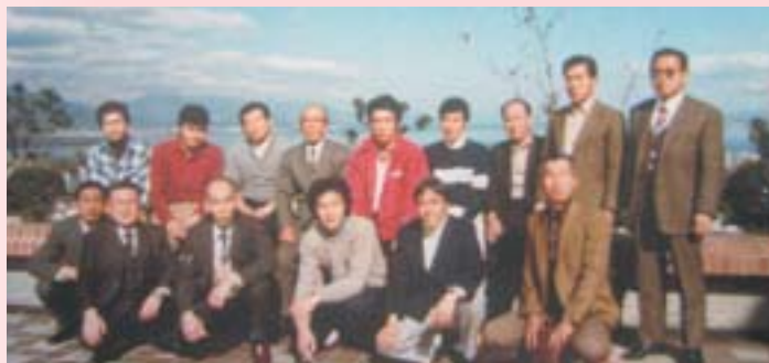
琵琶湖を背景に集合写真(私の左は25歳の松下会員)