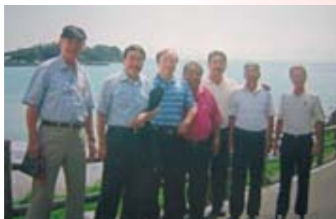
JC 20年会で壱岐に 旅行した時のスナップです