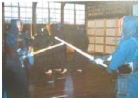
滋賀大学での交歓稽古の風景