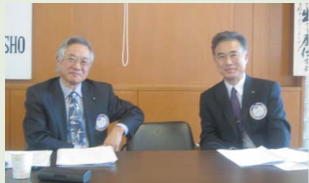
内海会長 & 西中副会長