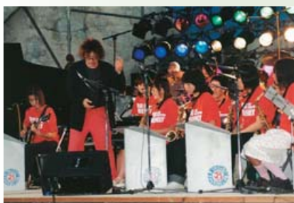
高砂高校ジャズバンド部参加