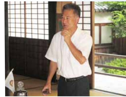
西中会長のあいさつ