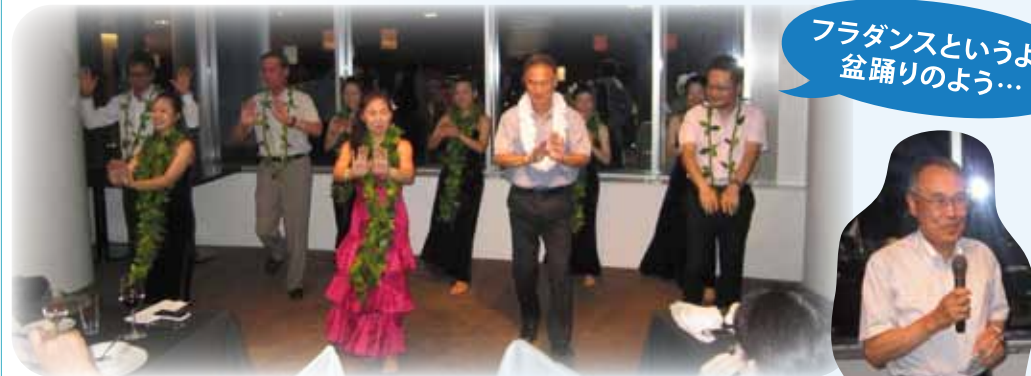
会長・副会長・幹事・副幹事も参加