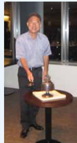
西中会長の 点鐘により終了