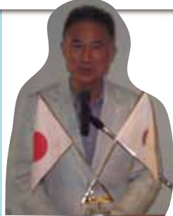
西中会長のあいさつ