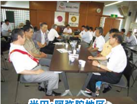
米田・阿弥陀地区