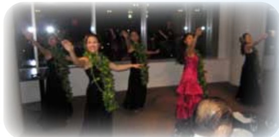
フラダンスチーム「アロハ・ブア・マカニ」