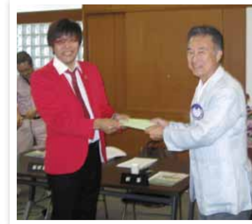
感謝状を渡される西中会長