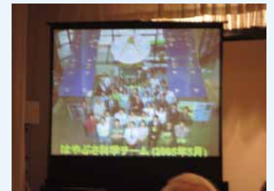
はやぶさ科学チームの紹介