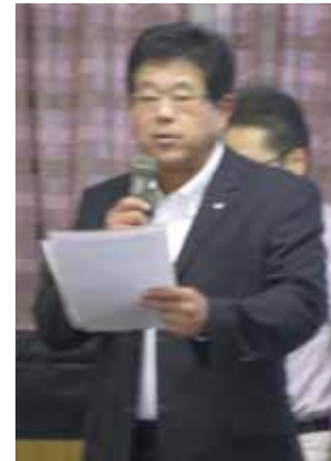
澤田会員による紹介