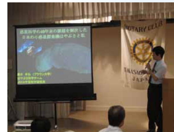
講演「はやぶさが解決した 惑星科学40年の課題」