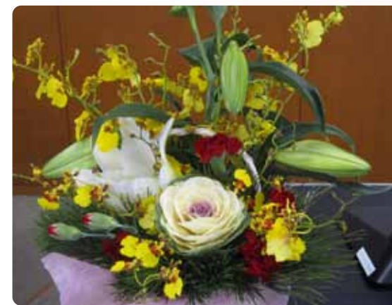
花を飾りましょう