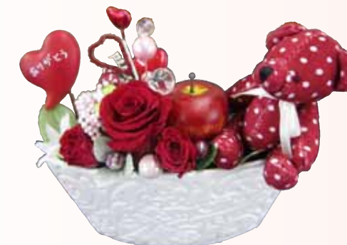
花を飾りましょう