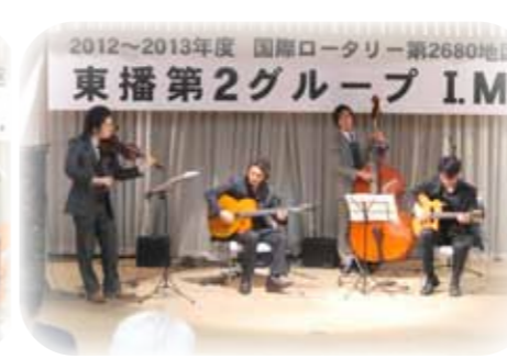
モンデュ コンサート