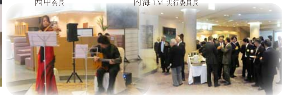
ロビーミニコンサート