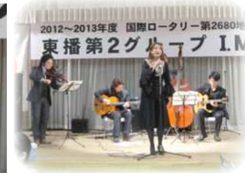
ひきばきょうこ コンサート