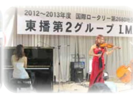
グラマラスジュエル コンサート