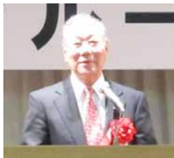
あいさつ 中右 地区幹事