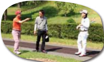
何やらよからめ密談中