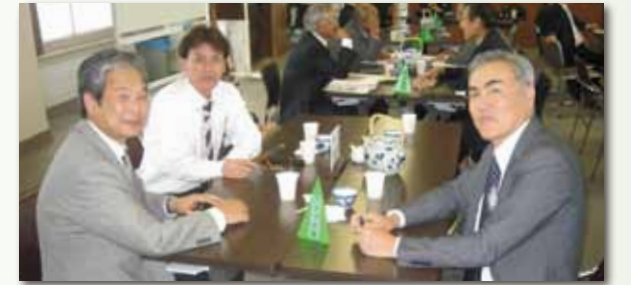
クラブ会報委員会