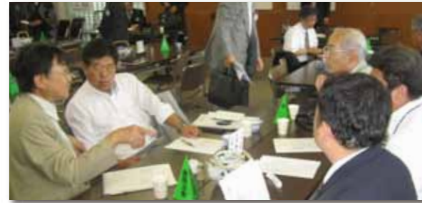
親睦活動委員会・出席委員会