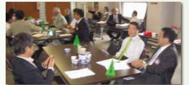
クラブ奉仕委員会 職業奉仕委員会