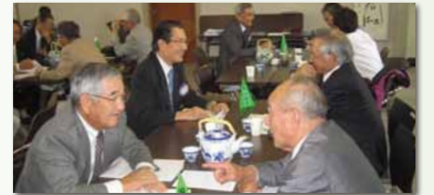
国際奉仕委員会・米山奨学委員会