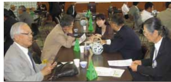
ロータリー財団 新世代奉仕委員会