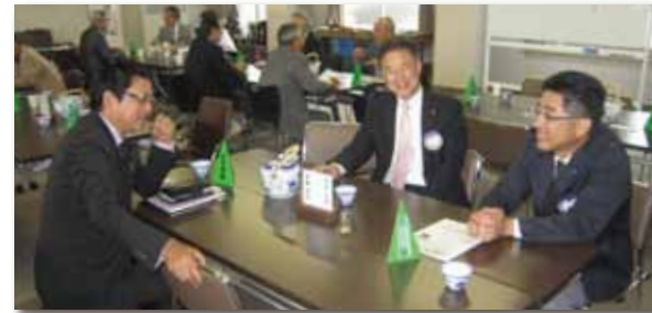
会員増強委員会・記録委員会