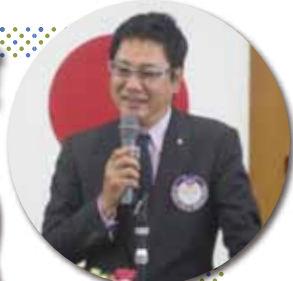
例会にて優勝スピーチ