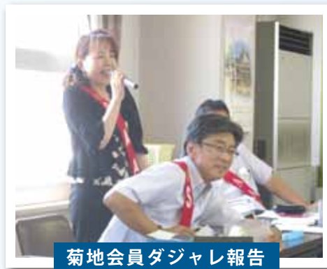
菊地会員ダジャレ報告