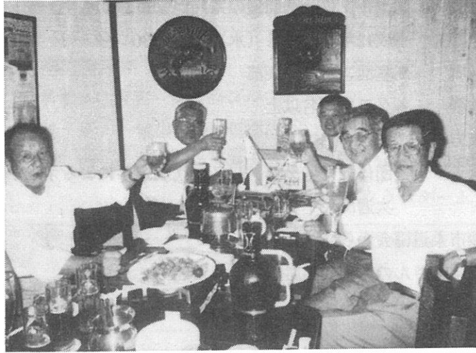
H12.8.3 納涼例会 今年度執行部 よろしく