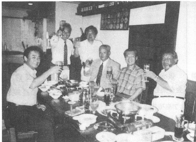
H12.8.3 納涼例会 親睦委員会 頑張るマス!!