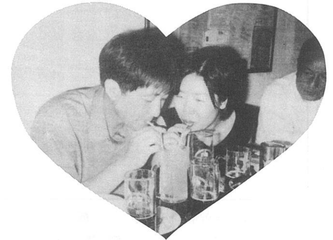
H12.8.3 納涼例会 ラブラブな奨学生夫妻