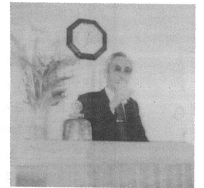
播磨コピー工業(株)菱田会員 (会長)の挨拶

しかし40年という年輪を重ねた割に内容が伴っておりませんので皆さんにご案内するのも恥ずかしい思いではありますが、敢えて申し上げればこの業界は技