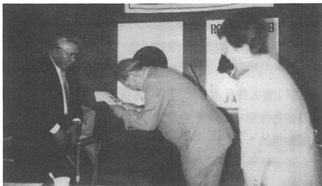
「あかりの家」へ車の贈呈式