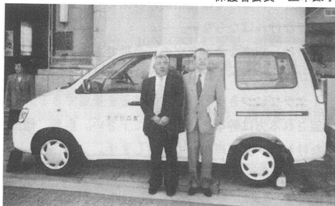
「トヨタワゴン車 （8人乗）」