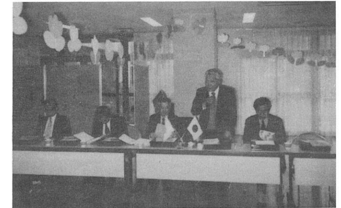
職場例会 「めぐみ苑」