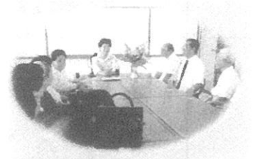
運営についての話し合い ハンチャト病院・県高齢者協会 日本高砂ボランティアインランパン