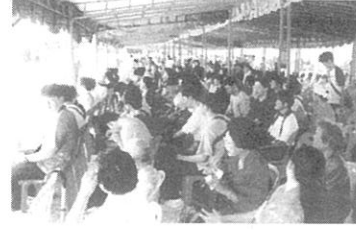
総勢700人以上の老若男女が参加 姫路福祉専門学校の研修旅行生も参加