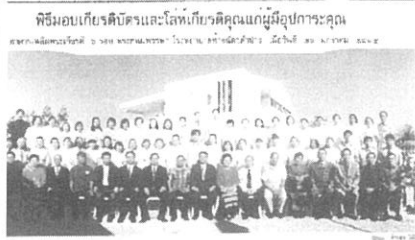
完成式 記念撮影 ハンチャト病院スタッフ全員