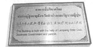
日本国草の根無償資金協力援助 (プレート)