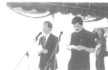
日本国祝辞 日本大使館