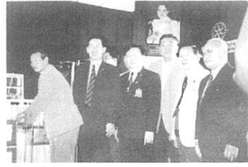
ランパンロータリークラブの 奉仕委員会と会員