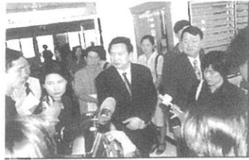
報道陣にインタビューを受ける タイ国社会公衆衛生局