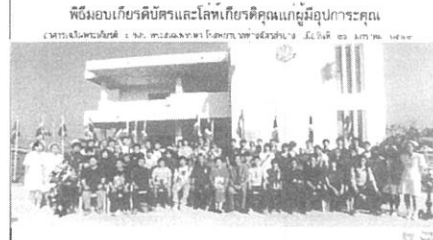
完成式 記念撮影 姫路福祉専門学校研修旅行生