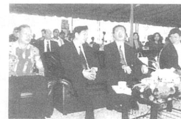
ランパン県・タイ国・日本大使館