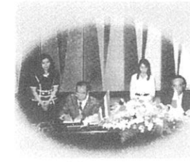
日本大使館での調印式 草の根無償資金協力 日本国大使・ランパン県高齢者協会