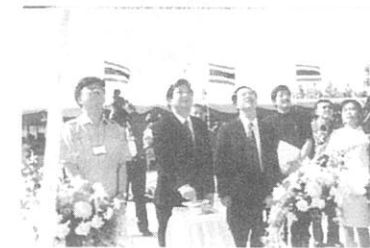
オープニングのカーテンコール タイ国社会公衆衛生局・日本国大使館 ハンチャット病院