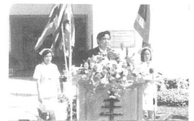
タイ国祝辞 タイ国社会公衆衛生局