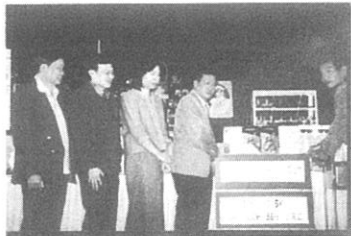
セレブレーション6棟寄付備品贈呈式 高砂青松ロータリークラブ有志会員に よる寄付 2001年11月23日