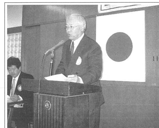
次年度志方会長より次年度理事発表