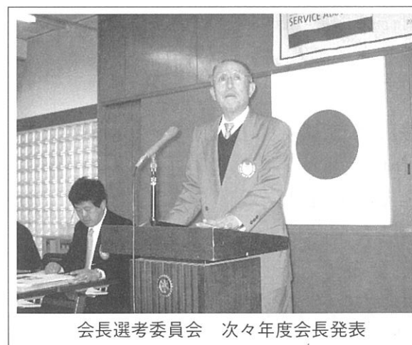
会長選考委員会 次々年度会長発表

諸先輩方が築き上げてこられました青松ロータリークラブも2年後、30周年を迎えようとしている今日、その責務は誠に大なりと自覚しつつ、又、皆様方の御協力なしではかなわぬ事と思いながら、ひたすら皆様方のご指導、ご鞭撻をお願いし、何卒ご理解頂きますようお願い申し上げます。