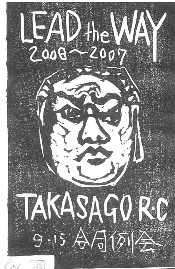
西田光衛会員（十輪寺住職）作