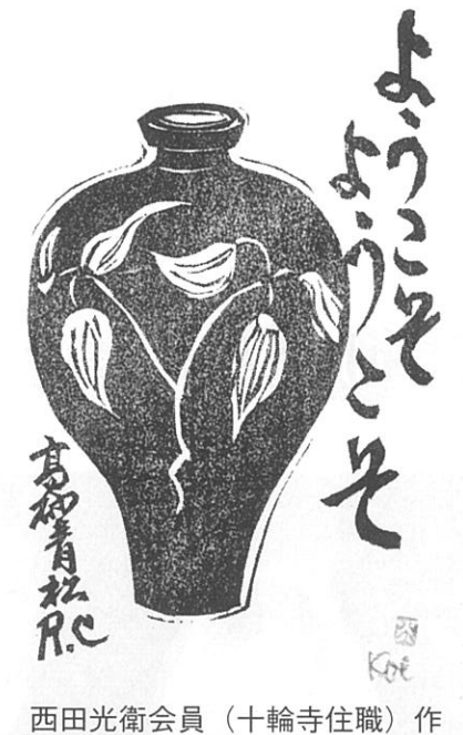
西田光衛会員(十輪寺住職)作