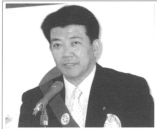
親睦委員会 都倉委員長