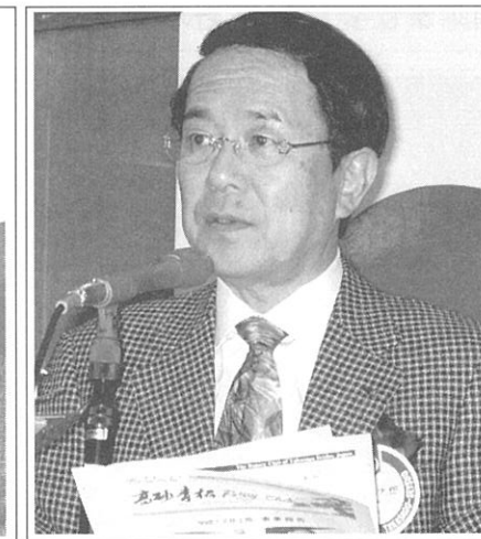
次年度理事・役員人事を発表する増田次年度会長