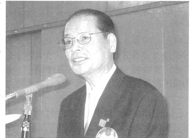
挨拶をされる田水ガバナー補佐

このように述べておられます……2007年度国際協議会講演集より抜粋 (三木ガバナーより配布されたもの)