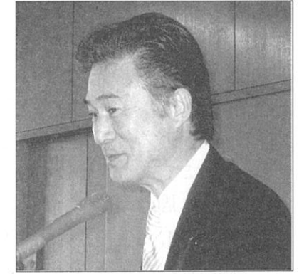
新世代委員会 西中委員長