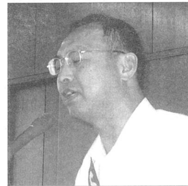
S.A.A. 竹原 S.A.A.