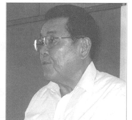
会員選考委員会 柿木委員長