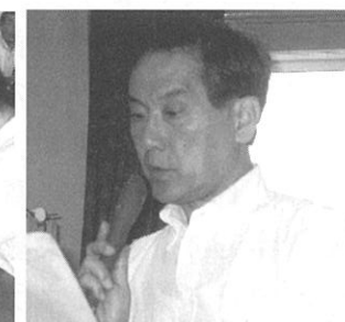
庄司実行委員会幹事