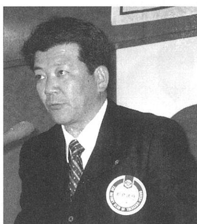
都倉記念事業委員長