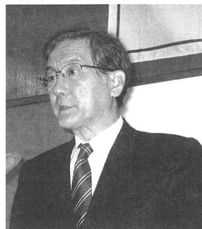
庄司実行委員会 幹事