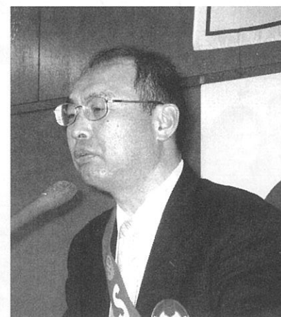
竹原記念誌委員長