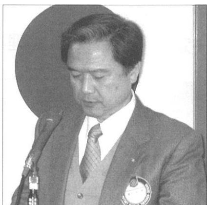
植杉雑誌広報委員長