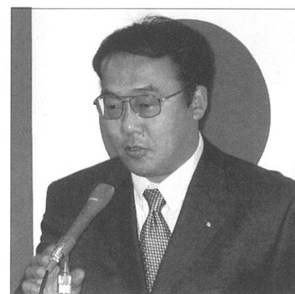
亀本プログラム委員長