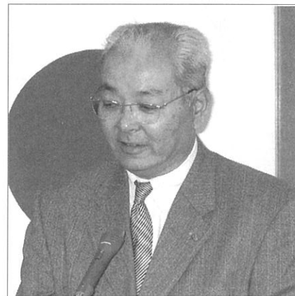
川崎増強・職業分類委員長