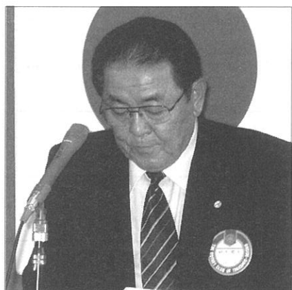
柿木会員選考委員長