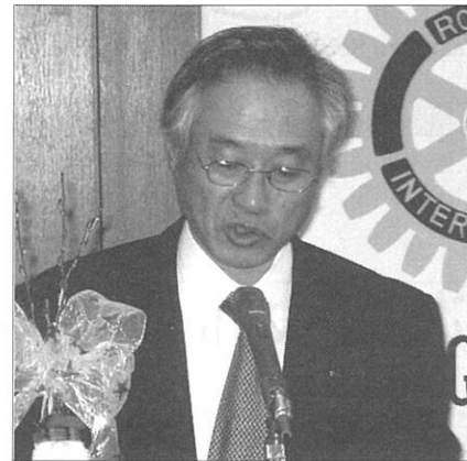
内海ロータリー財団委員長