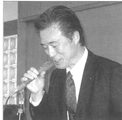
西中新世代委員長