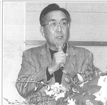
来賓挨拶 岡 高砂市長