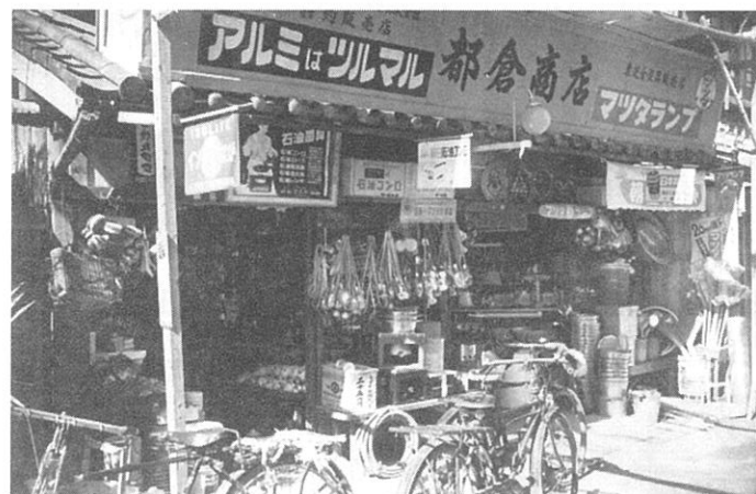
〈左側の写真〉 創業者である都倉達殊さんの御先代が荒井町扇町で商売を始められた頃の「都倉商店 (荒物屋)」のワンショット (昭和35年撮影)