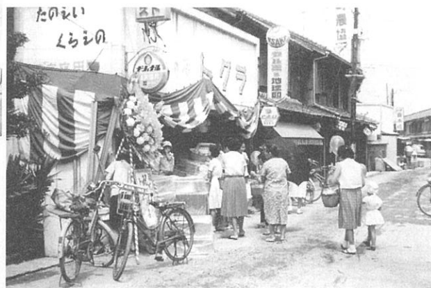
〈右側の写真〉 (株)トクラとしてスタートした昭和39年の「売り出し風景」のワンショット。 (昭和39年撮影)