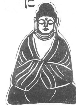
西田光衛会員 (十輪寺住職) 作