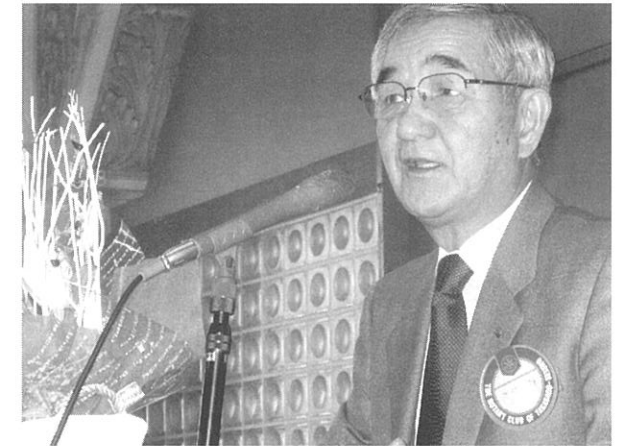
卓話される鹿間会員