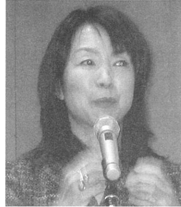
コーディネーター役の 作家 玉岡かおるさん