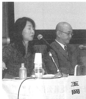
パネルディスカッション風景 その2