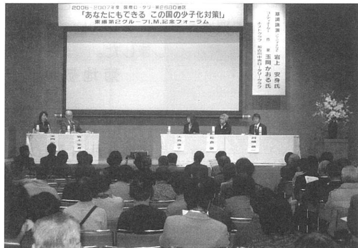
パネルディスカッション風景その1