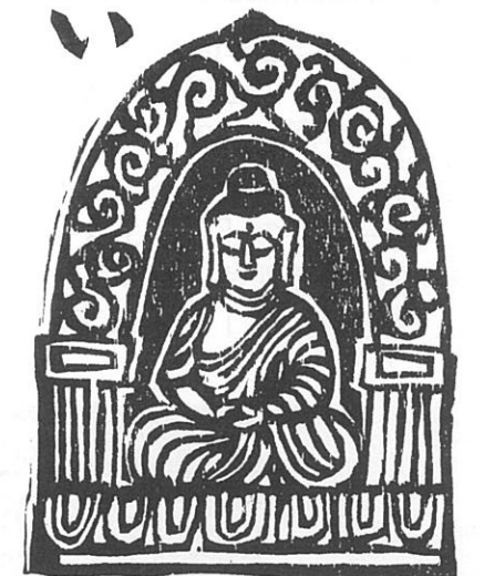
西田光衛会員（十輪寺住職）作