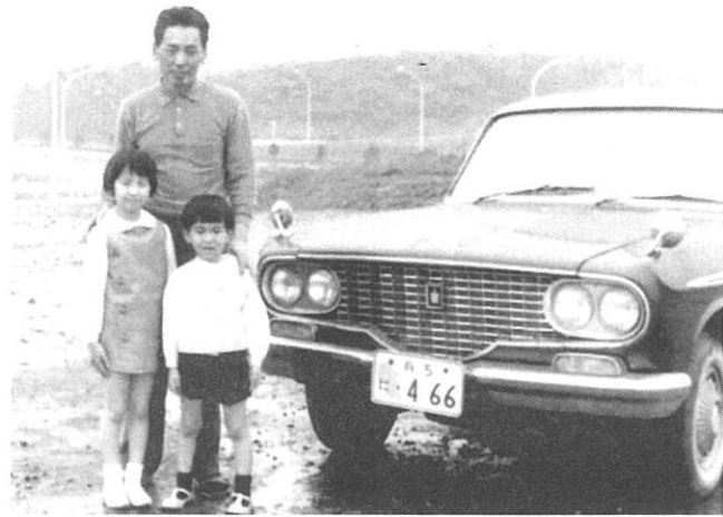
父 悦朗 (28才), 姉 佳子 (6才) と私 (4才)。『高砂市民まつり』“いかだ下り競争”での模擬結婚式。私 (32才) が、自ら企画、出演? した思い出のワンショット。 (昭和38年撮影)