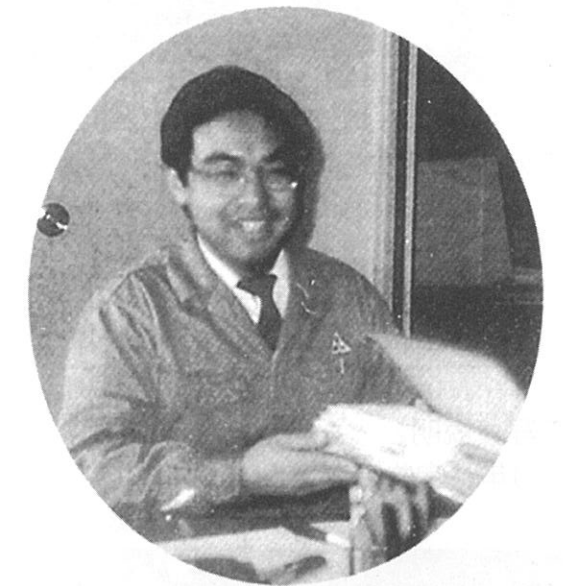
仕事中の姿を撮った唯一の写真。人事係長時代の私(35才)。この時は10年近くも人事業務を担当するとは全く思っていませんでした。