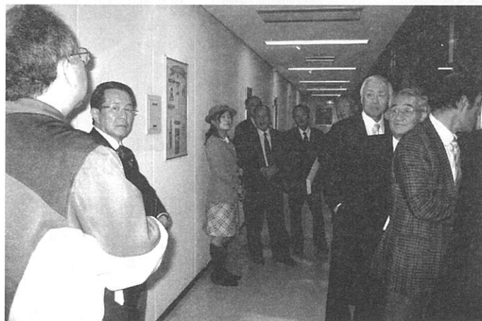
特別にお許しをいただいて撮影しました