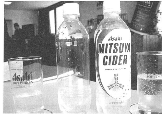
左が生産直後の商品、右が通常商品です。飲みくらべ、違いのわかる男になりました