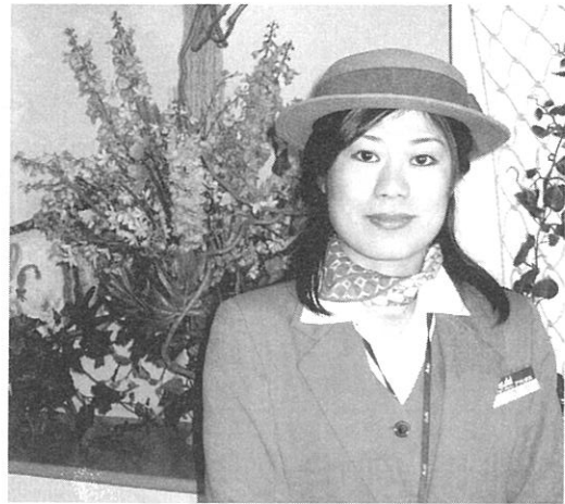
工場を案内していただきます