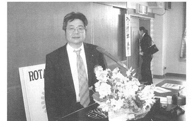
佐野記念誌副委員長