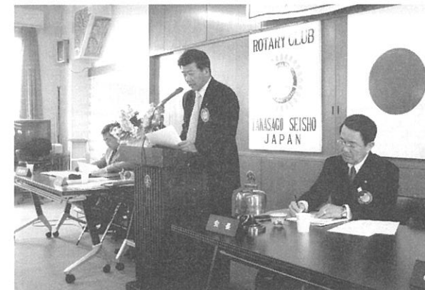
都倉記念事業委員長