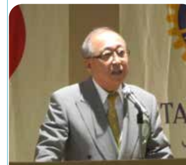
高砂RC片嶋会长 あいさつ