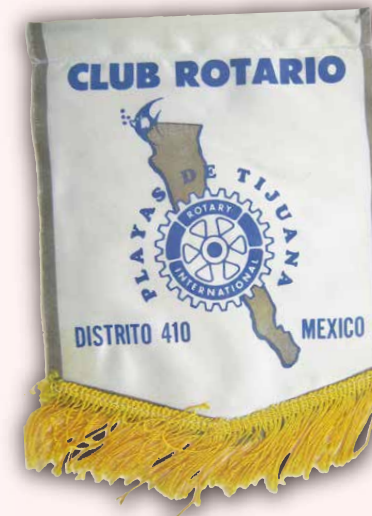
メキシコロータリー バナー