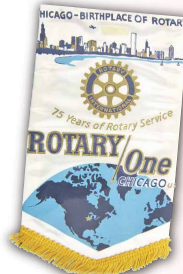
シカゴロータリー バナー