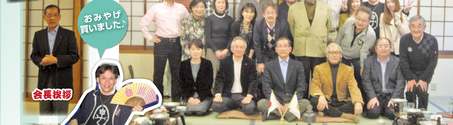
おみやげ 買いました♪