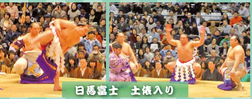
日馬富士 土俵入り