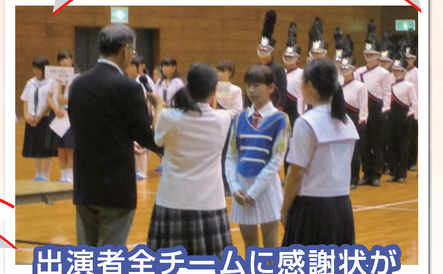
出演者全チームに感謝状が贈呈されました!!