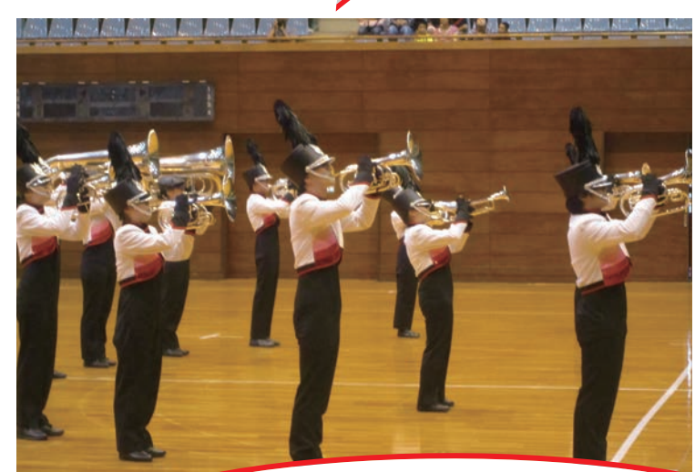
Himeji Saints Drum & Brass Corps