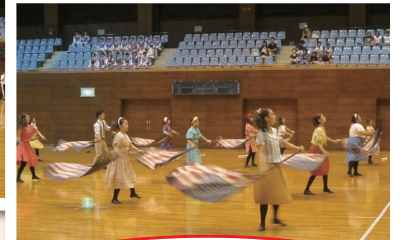
Color Guard Team Noah