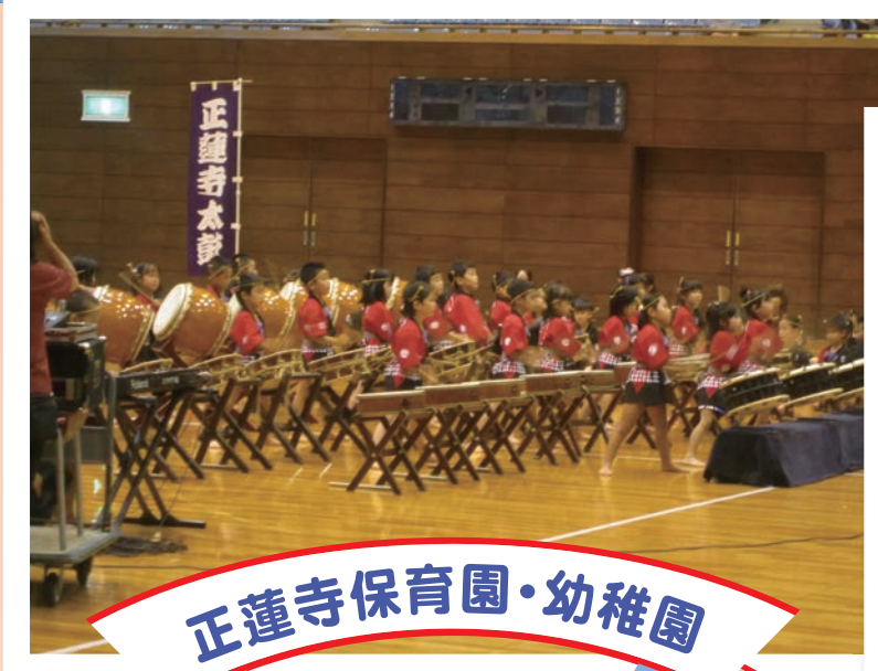
正蓮寺保育園・幼稚園