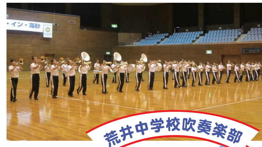
荒井中学校吹奏楽部