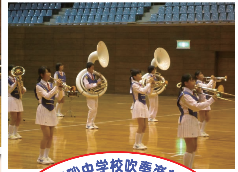
高砂中学校吹奏楽部