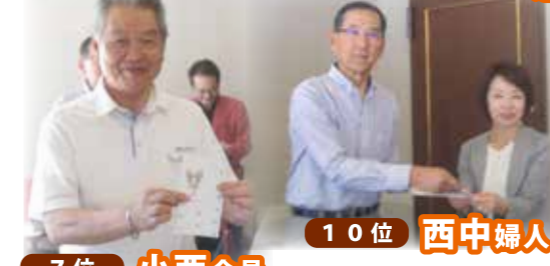
7位 小西会員 10位 西中婦人