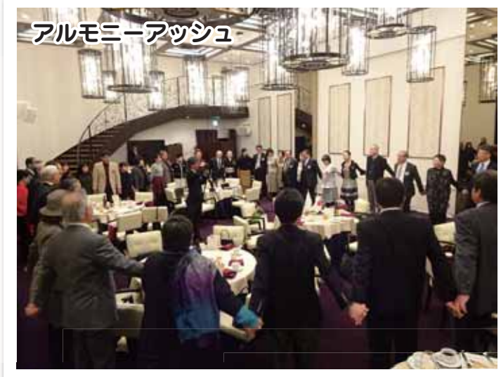
アルモニーアッシュ