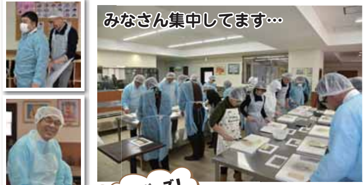
みなさん集中してます...