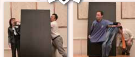
福島氏によるバントマイムショー!