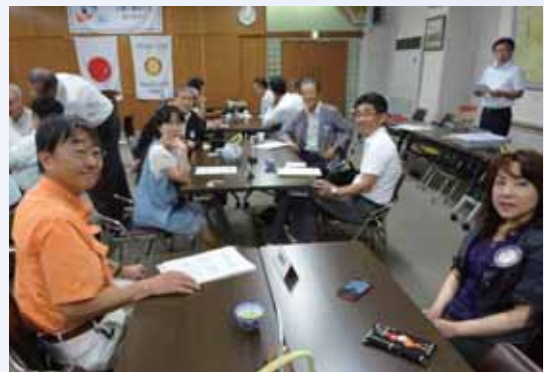
米田・阿弥陀地区