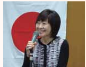
地区会員増強・拡大副委員長

変わらないでほしいロータリーの真髄を、バッジの誇りを、若いロータリアンは切磋琢磨して学んでいかななくてはなりません。ベテランロータリアンは、厳しく温かく育てて頂きたく願っております。