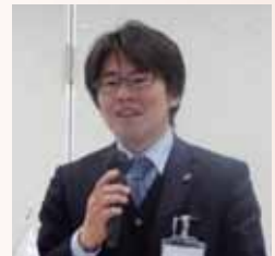
サービス付き高齢者向け住宅 しおさきケアコート 副施設長