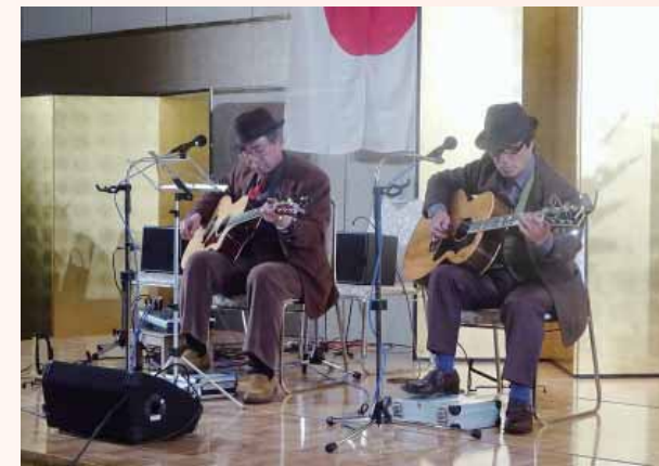
ギターデュオ演奏 リラックスカフェ