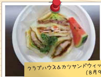
クラブハウス&カツサンドウィッチ (8月9日)