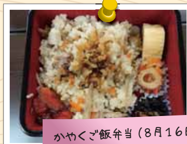
かやくご飯弁当 (8月16日)