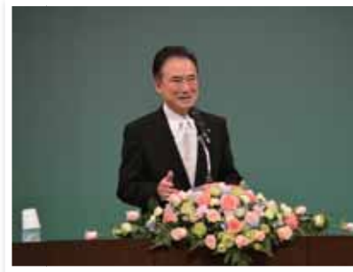
高砂応援大使 金村 義明様