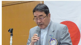
廣瀬明正 ロータリー財団委員長