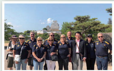
オーストラリア・モウィRCの皆様と