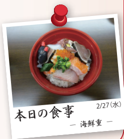
本日の食事 2/27(水) - 海鮮重 -