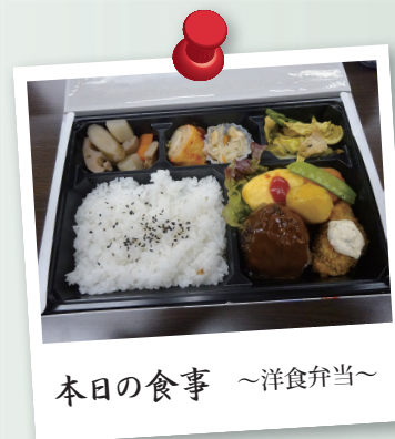
本日の食事 ~洋食弁当~